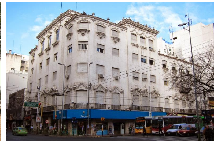
Av. Colón y General Paz Sede Centro

En la inauguración del edificio de sede Centro, se realizó una muy importante muestra artística con más de 200 obras pictóricas y escultóricas de destacados artistas cordobeses y nacionales. Desde entonces, el Jockey Club Córdoba desde la Subcomisión de Cultura creada en 1.946, realiza una intensa actividad cultural llevando a cabo diversas manifestaciones artísticas e intelectuales en la ciudad, organizando para los socios y la sociedad toda diferentes eventos como conferencias, conciertos, exposiciones,